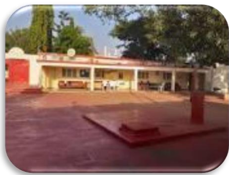
Escola Primária Completa de Salamanga