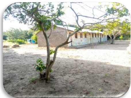
Escola Primária Completa de Majajane